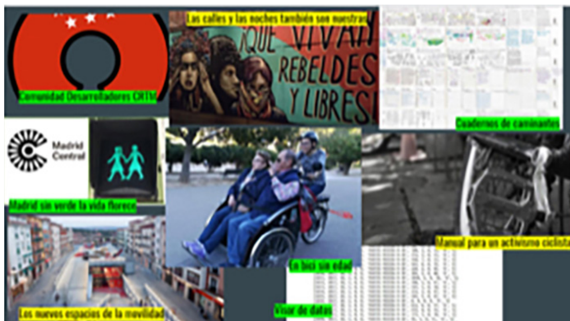
Grafico 3. Imagen de los proyectos seleccionados en la convocatoria 2017

Manual para un activismo ciclista efectivo. Su idea es detectar oportunidades del sistema para articular propuestas vinculadas al ciclismo, de manera que los activistas de la bici puedan trabajar con el Ayuntamiento y no contra él.