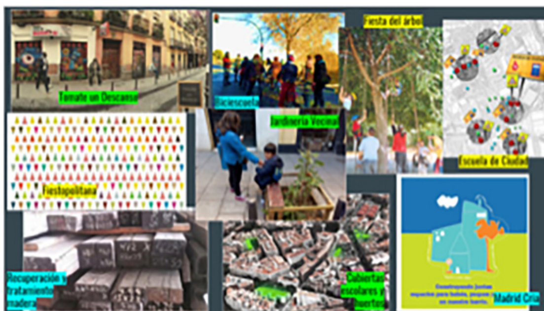
Gráfico 2. Imagen de los proyectos seleccionados en la convocatoria 2017

Jardinería Vecinal en el Espacio Público. Su propósito es dotar a los alcorques de un vallado con bancos que evite suciedades y promueva lugares de encuentro.