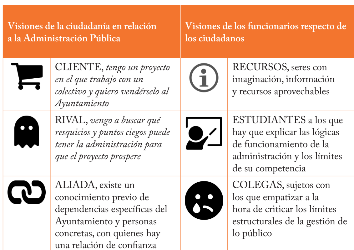
Tabla 1. Visiones del otro